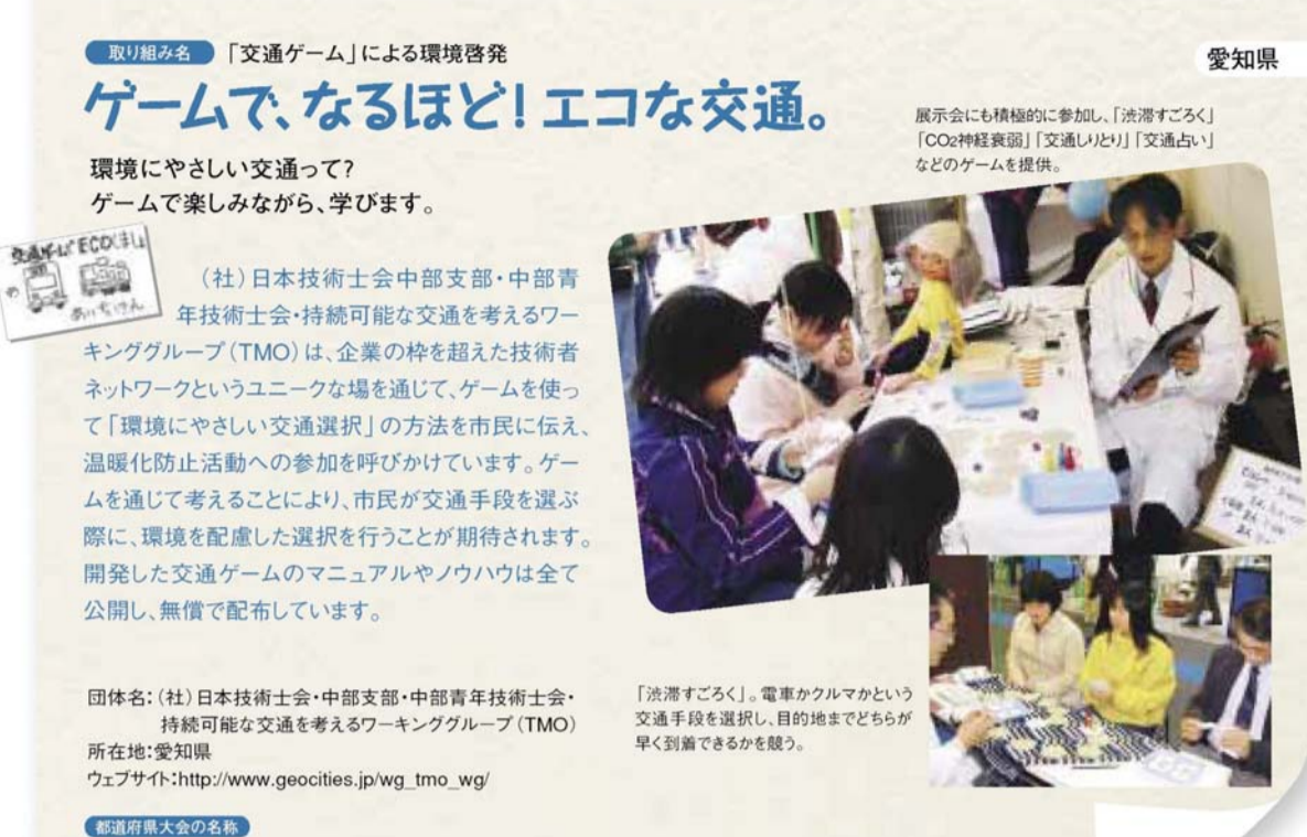
スタッフ温暖化大作戦 2008 全国大会で優秀賞受賞