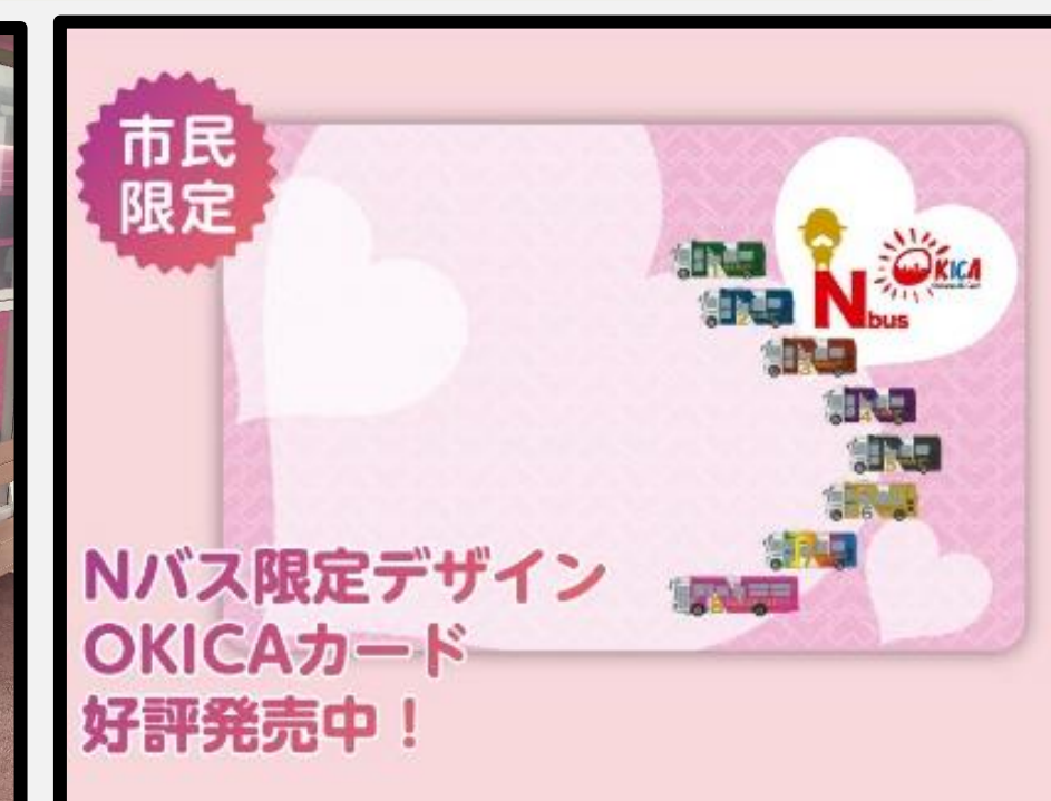
Nバスオキカの基デザインはNむすが担当