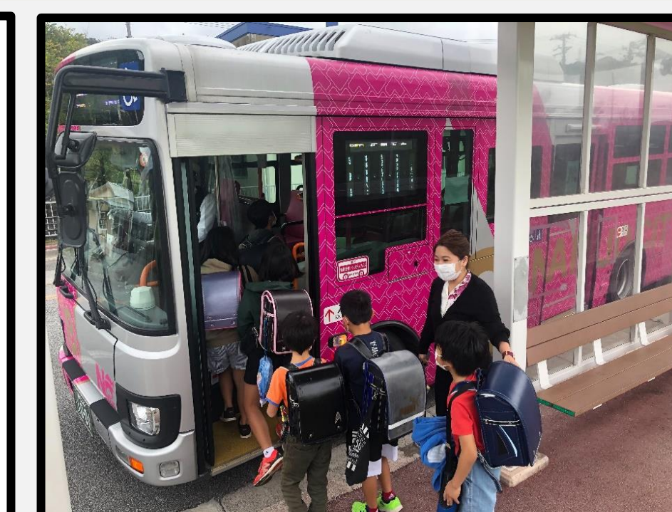
バス車内アテンドの様子