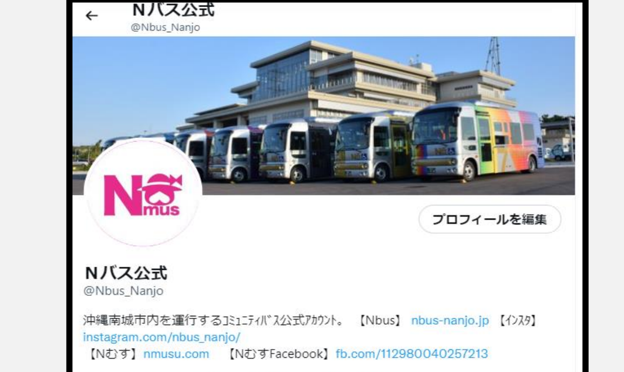
Twitterフォロワーは1,000人を突破