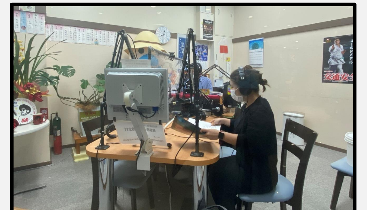
ラジオ生放送の様子