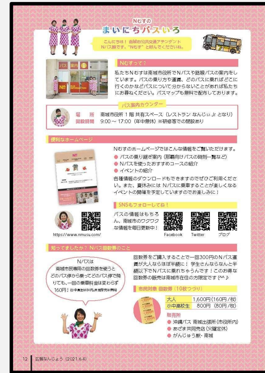
市広報での担当ページ

TwitterやFacebookでは県内のバス運行情報の他、イベント情報、市内観光情報などを毎日更新。担当するラジオコーナーは毎月第1・第3水曜日に生放送を継続中。