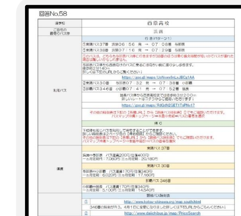
オンライン通学案内の例